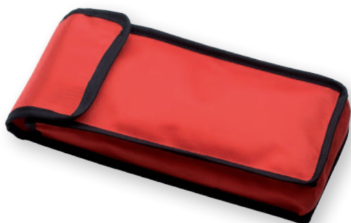
Bộ AMS MAXI - AV6240